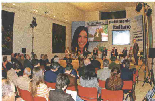
Un momento dell'incontro di Siena dedicato al patrimonio agroalimentare italiano

Nonostante il buono stato di salute del prodotto alimentare italiano di qualità, permangono aree grigie e nere da approfondire e da chiarire con la massima urgenza.